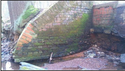
Abb. 3: Unterspülte Mauer am Ablaufbauwerk, 19.02.2019