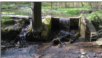
Abb. 1: Beschädigtes Ablaufbauwerk, 22.06.2021