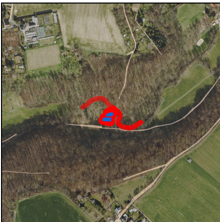
Lageplan Maßnahme, Maßstab 1:10.000