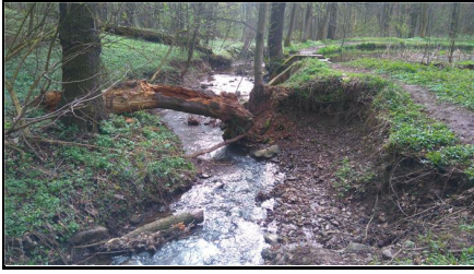
Abb. 2: Beschädigter Damm, 06.04.2017