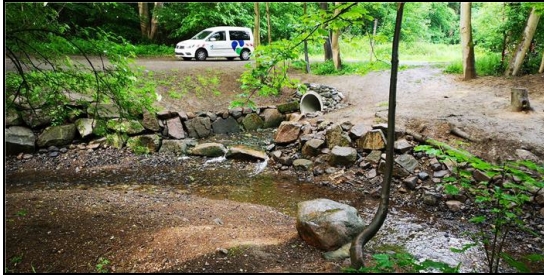
Abb. 5: Mündung des Teichablaufs nach Fertigstellung, 05.06.2020