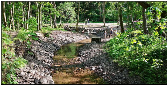
Abb. 7: Erweitertes Abflussprofil zum Schutz des Teichdamms, 08.05.2020