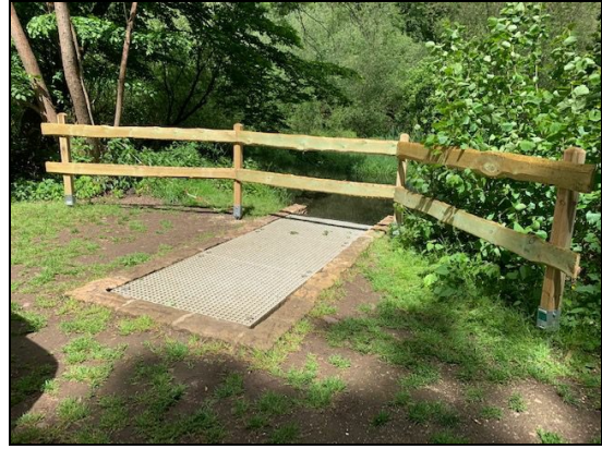
Abb. 6: Uferschutz durch Besucherlenkung, 26.05.2020