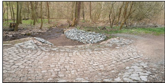
Abb. 8: Regulierter Teichzulauf zum Schutz der Anlage, 26.03.2020